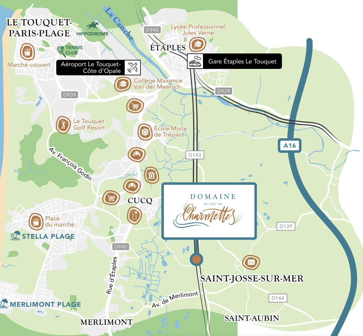
Plage - Le Touquet