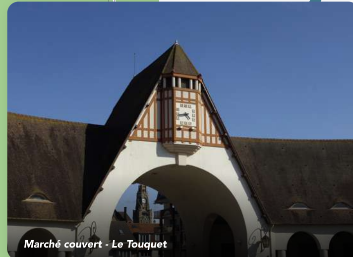
Marché couvert - Le Touquet