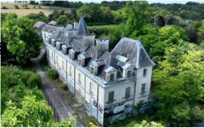
Le Domaine de La Massaye, situé en Ille-et-Vilaine au coeur d'un parc de 9,7 hectares, est à l'abandon depuis 2005

Le compromis de vente a été signé en juillet 2024 entre la société d'économie mixte Terre et Toit, en charge de l'aménagement de la Zone d'aménagement concerté (ZAC) du domaine de la Massaye ,